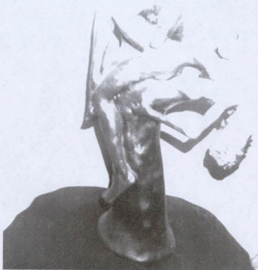
mão de violência 1986