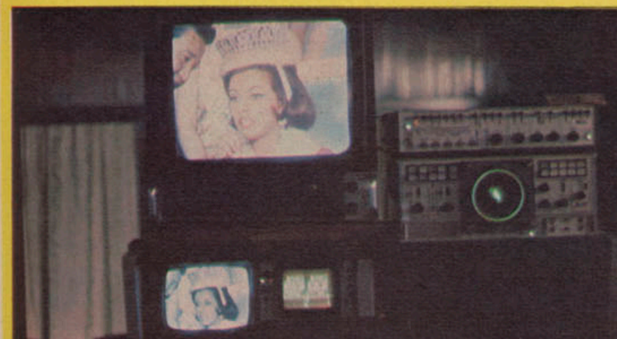
Os presentes ao Canecão viram o tape a cores do último concurso de Miss Universo.

Com muita alegria e animação, a Rede Tupi de Televisão reuniu publicitários, banqueiros, representantes de entidades financeiras, jornalistas e funcionários associados com suas famílias numa festa de confraternização de fim de ano. Três mil pessoas lotaram o Canecão, assistiram ao show de Chico Buarque, Isaac Karabtchevsky, Jacques Klein, MPB-4 e Orquestra Sinfônica e viram, pela primeira vez, o equipamento de TV a cores que a Tupi utilizará a partir de 31 de março. Houve uma demonstração da transmissão a cores, entusiasmando os presentes, e depois uma distribuição de brindes, promovida por Bibi Ferreira. Os principais eram um receptor de TV, já adaptado ao novo processo, e passagens aéreas para o país e o exterior.