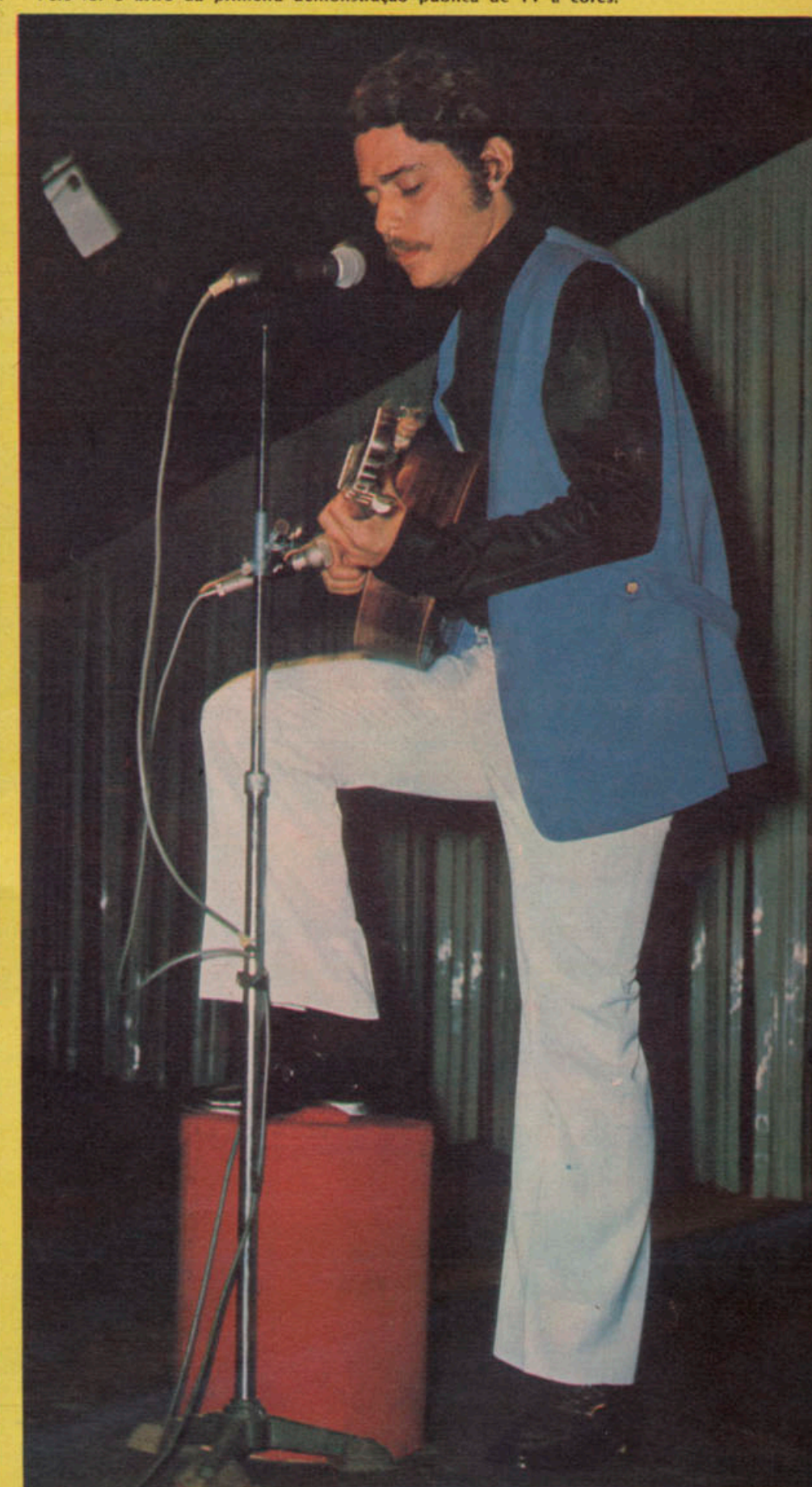
Três mil pessoas lotaram o Canecão na noite de confraternização da Tupi. Durante quatro horas eles se divertiram muito, falaram de seus planos para 1972 e aplaudiram entusiasmadamente Chico Buarque (acima).