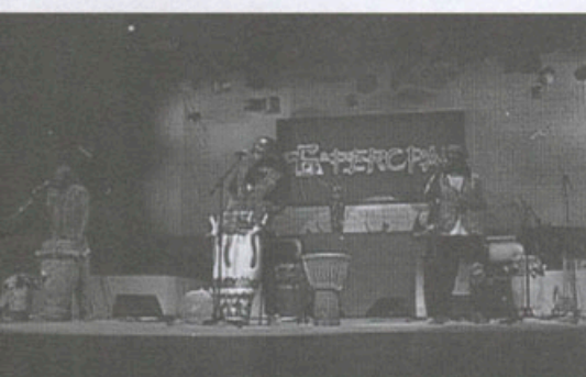
Festival de Percussão no Multishow em Revista