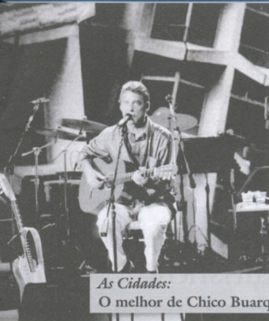
As Cidades: O melhor de Chico Buarque