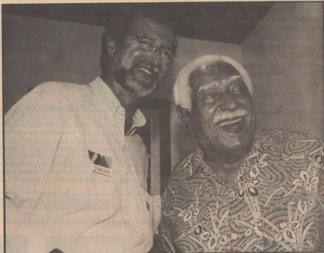
O Governador Eduardo Azeredo encontra com Dorival Caymmi, em Pequeri, no dia 04 de setembro. Caymmi afirmou que se fosse eleito em Minas votaria na reeleição de Azeredo. Página 3