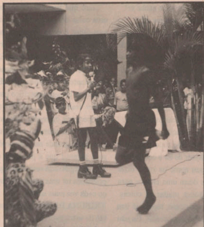
Alunos da Manarinno encenam a lenda do Saci