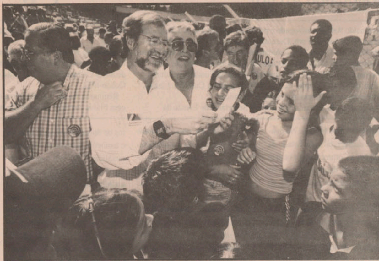
Azeredo visita Tocantins e é recepcionado pela população no estádio do Clube Itararé