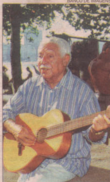
DORIVAL: programa na MPB FM

O programa foi ao ar dia 14. No roteiro, a vida e a obra desse que é um dos baianos mais queridos da Música Popular Brasileira. Entre as composições do artista estão Você Já Foi À Bahia? e O Que É Que A Baiana Tem? . Além disso, os ouvintes também se emocionam com os depoimentos dos filhos Danilo, Dori e Nana Caymmi. (Viviane Pires)