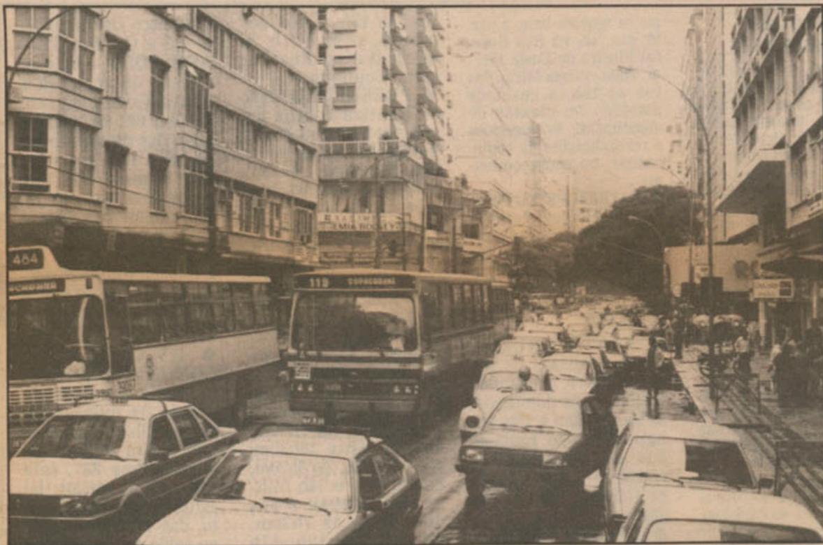
A rua, uma das principais da cidade, recebe milhares de veículos todo dia, mas o trânsito é caótico