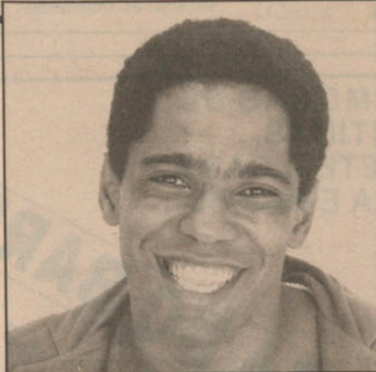
Mongol interpreta ‘Agonia’, além de outros sucessos