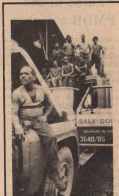
400 garis saíram às ruas