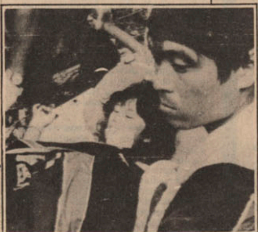
Helicópteros retiraram os sobreviventes da queda do Jumbo