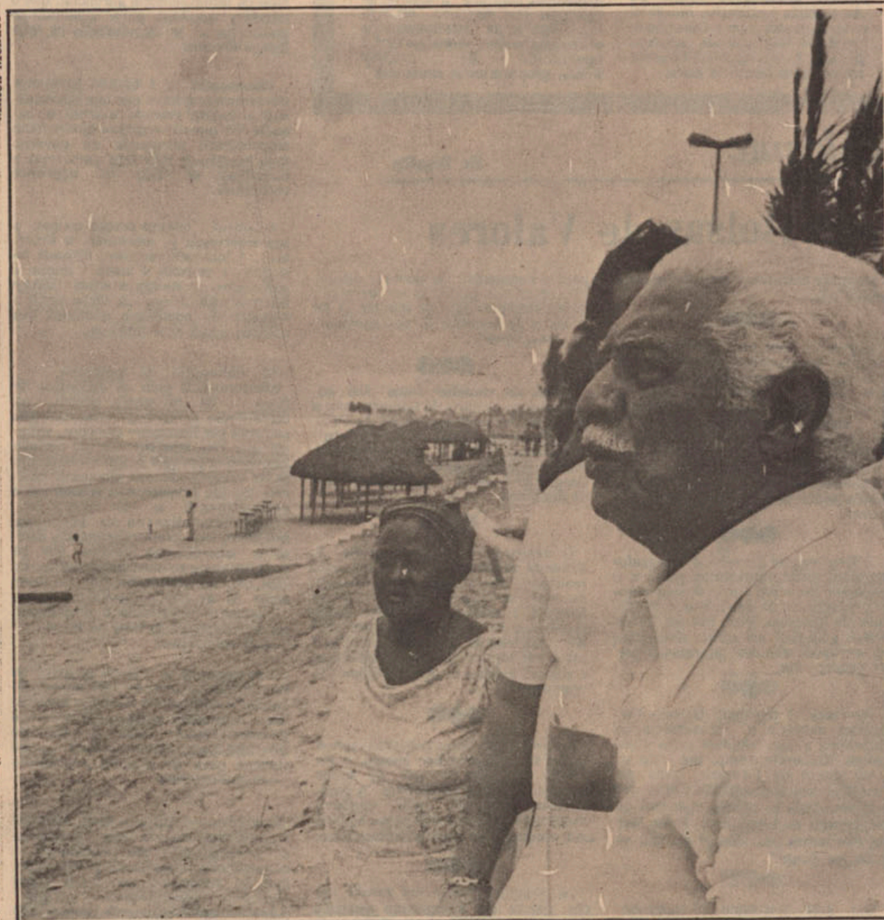
O poeta foi conhecer a nova orla e disse que agora pode se inspirar novamente na beleza de Itapuã