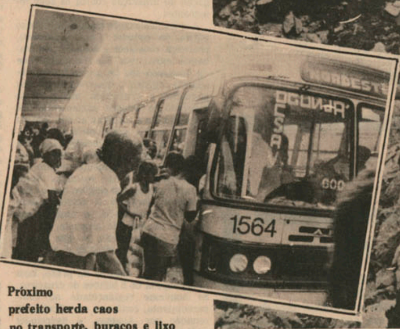
Próximo prefeito herda caos no transporte, buracos e lixo