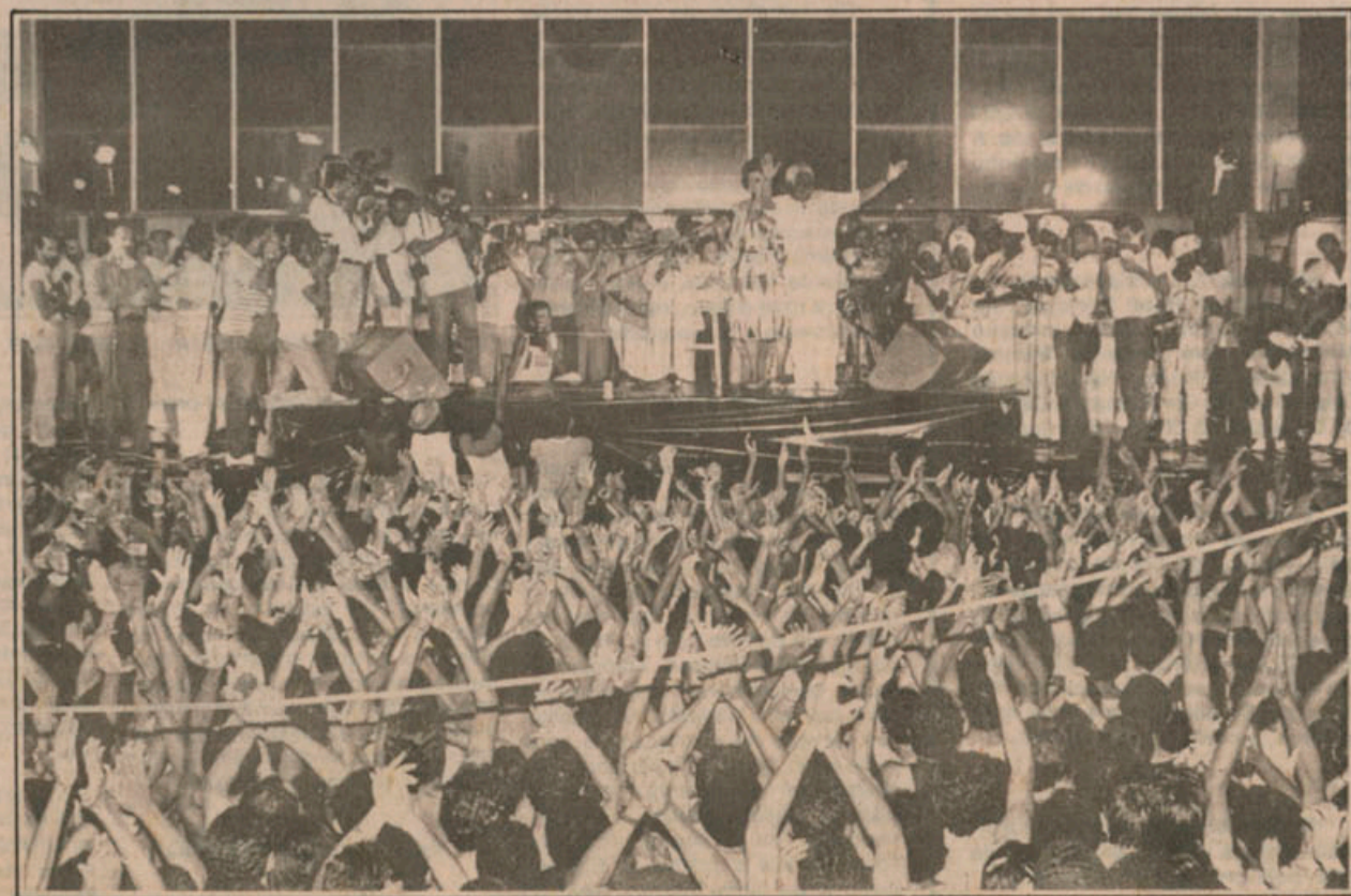
Milhares de pessoas foram saudar Dorival Caymmi pelos seus setenta anos

Durante seis horas e meia a reportagem de A TARDE acompanhou uma mulher grávida que sentia fortes dores: o repórter e a senhora ficaram das 9 às 15h30min na Maternidade Tsylla Balbino e, por fim, tiveram que sair dali por absoluta falta de atendimento. Estão fechados os setores de obstetrícia do Hospital Ana Nery, do Hospital Roberto Santos e mais três postos (Pág. 2).