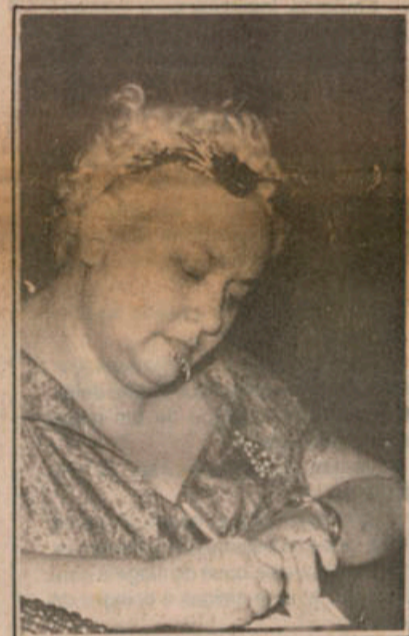
A cantora Leny Eversong