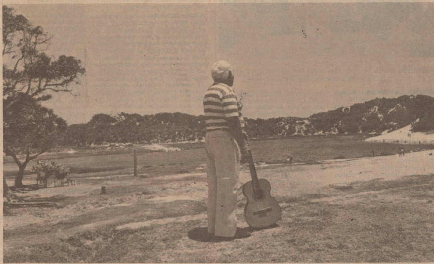
Caymmi em Abaeté. Esta foto eu fiz em 1979 durante nosso passeio pela cidade

Cabelos branco, tez morena e barriga saliente. Quando fala deixa fluir o dengo e a magia desta Bahia que sabe cantar como ninguém nos seus versos enaltecendo o mar, os jangadeiros, a morena e o João Valentão. Este é um retrato do Dorival Caymmi que estamos acostumados a ver e ouvir nos seus discos e nos programas de rádio e televisão. Porém, quando o conhecemos pessoalmente passamos a amá-lo e surge a vontade de preservá-lo como uma figura mágica, um homem que espalha felicidade e principalmente doçura. E Caymmi é isto! Lembro-me que em 1979 tive a felicidade de juntos percorrer os pontos mais tradicionais de Salvador: Itapuá, Abaeté, Bonfim, Amaralina, Mercado Modelo e a praça com seu nome em Itapuá, quando ele reencontrava a gente simples que lhe cumprimentava com um carinho especial. Não era a abordagem pura e simples de um fã que encontrava um cantor de sucesso do momento. Mas, abordagem era diferente. Doce e fraternal! E o velho de cabelos brancos, com sua tradicional camisa listrada, na horizontal, salientando mais ainda sua vasta barriga, abraçava-os e conversava como conhecesse há muito tempo àquela gente que lhe estimava.