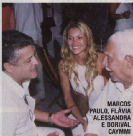
MARCOS PAULO, FLÁVIA ALESSANDRA E DORIVAL CAYMMI