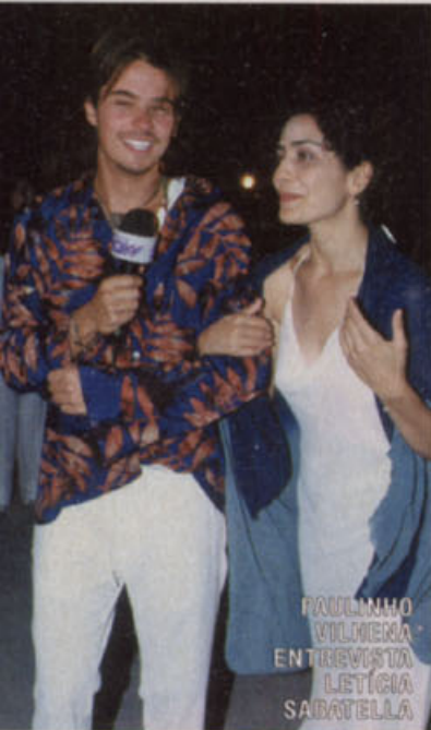
PAULINHO VILHENA ENTREVISTA LETÍCIA SABATELLA