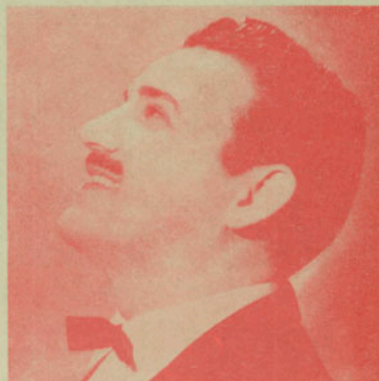
TRANSCRIÇÃO PARA ACORDEON DE MARIO MASCARENHAS