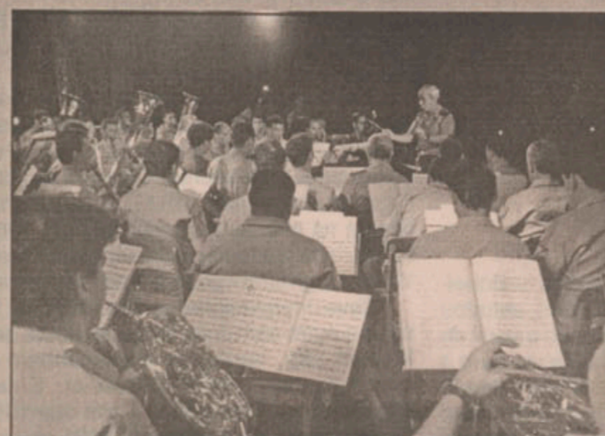
A Banda do Corpo de bombeiros se apresentou na quinta-feira