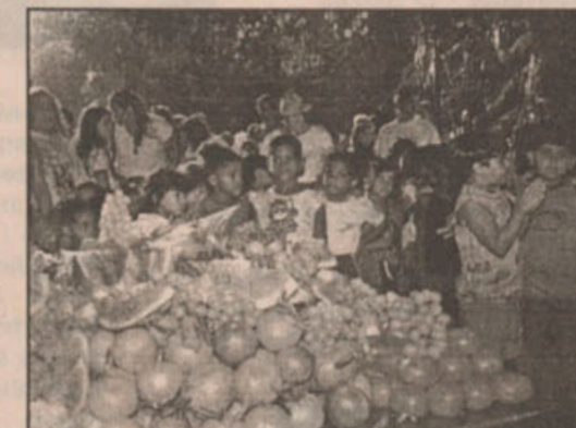
Foi oferecida uma mesa de frutas aos estudantes