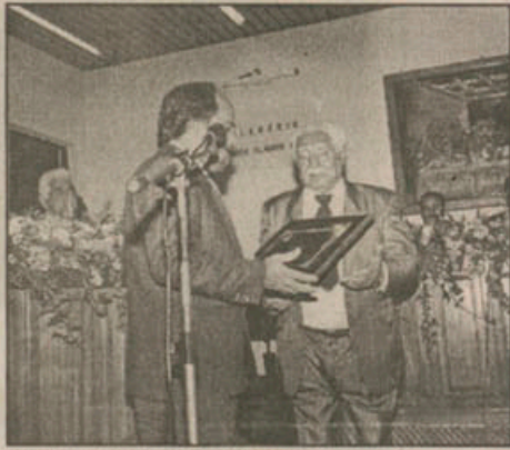
Dorival Caymmi - cidadão