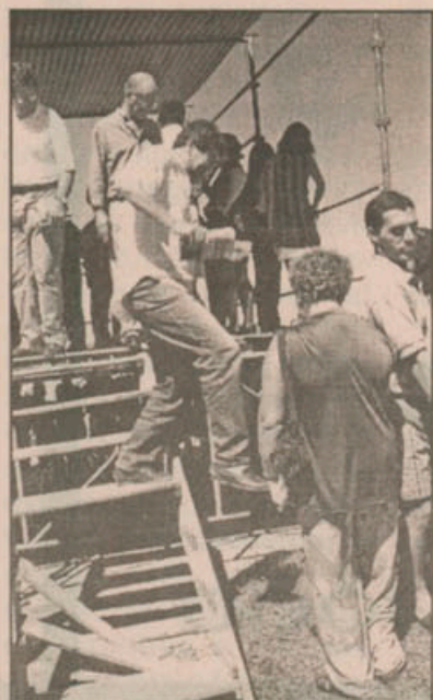
A ESCADA QUEBROU

cinto dos guardas: um cassetete enorme que vai até o joelho. A versão Dragões da Independência, uma beca de gala com direito a luvas brancas e botas, fez o maior sucesso na sessão solene da Câmara. No balanço final, a comunidade aprovou.