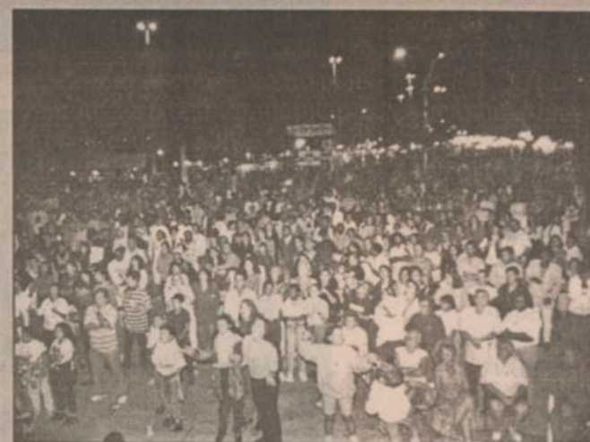
O primeiro dia de festa reuniu um público razoável

De acordo com o programa de festividades da prefeitura, após a cerimônia de entrega dos títulos de Cidadão aos homenageados na Câmara, seguiu-se a apresentação da Banda do Corpo de Bombeiros do Estado do Rio de Janeiro, na Praça do Centro. Esta, em um concerto irrepreensível, brindou o público com belíssimas peças populares, como Aquarela do Brasil, de Ari Barroso, As Pastorinhas, de Braguinha, Coação de Estudante, de Milton Nascimento, além de músicas clássicas. Depois dela, foi a vez do Coral Amadeuzinho apresentar-se para um público que esperava o show de Danilo Caymmi. Quando este finalmente pisou o palco, a ovação foi geral. Danilo abriu a noite com "You Pra Maracangalha" e a partir daí seguiram-se pérolas atrás de pérolas. No fim do show, uma surpresa: o filho chamou o pai para acompanhá-lo em dueto. Dorival não se fez de rogado. No palco, o mais novo Cidadão Riostrense cantou e sambou, com graça e maestria.