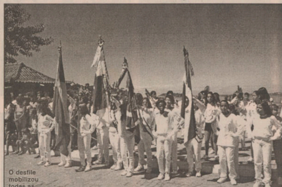
O desfile mobilizou todas as escolas do município