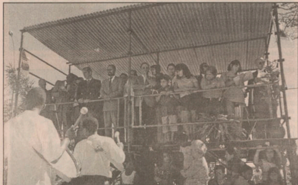
O palanque reuniu autoridades locais e de municípios vizinhos

Pica-Pau Amarelo, comandados pela Banda Marcial Henrique Sarzedas; Colégio Estadual Jacinto Xavier Martins, CIEP Mestre Marçal - 349 - municipalizado, Escola Municipal Acerbal Pinto Malheiros, E. E. Fazendas Reunidas Atlântica - municipalizada e Escola Municipal Maria da Penha de Oliveira, comandadas pela Banda Marcial Jorge Ramos; Centro Educacional Casulo, E. E. Fazenda da Praia - municipalizada, Escola Municipal Carlos Maurício Branco e Escola Estadual Pedro Primeiro, com a Banda de Tambores Dayse Pamplona; Colégio Municipal Professora Améria Abdalla, Escola Estadual Dom Bosco - municipalizada, Escola Municipal Trindade, Escola Municipal Fany Batista Esteves e Escola Estadual Cinamomo, com a Banda Adão Carlos Ribeiro; as Escolinhas de Futebol e por último, Surpresas de Mara Cavaleiros, sob a batuta da Banda de Conceição de Macabu.