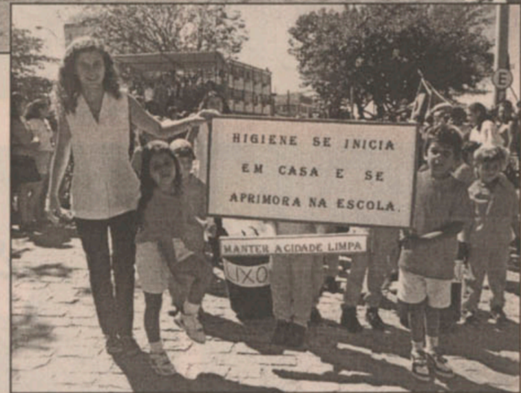
As escolas apresentaram desfiles temáticos