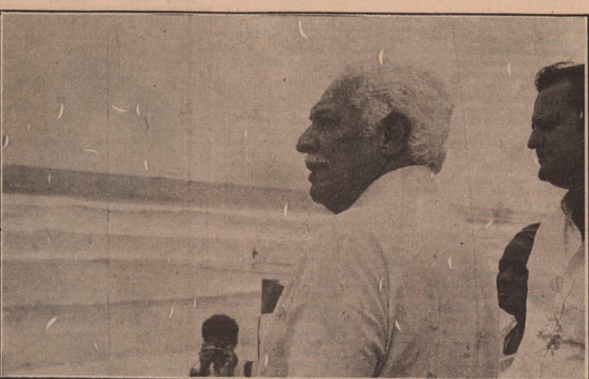
Após o período relativamente longo de ausência, o poeta reviu ontem a sua fonte de inspiração.

Gordilho ressaltou que, como parte do Projeto Orla, na sexta-feira, será lançado o personagem Orindo, menino pobre, filho de uma baiana de acarajé, nascido em Itapuã e que ficará encarregado de cuidar e conservar a nova orla, passando a lição para os moradores. Esse trabalho de conscientização de moradores e usuários da orla, será lançado em vários livros. Essa semana é o número um.