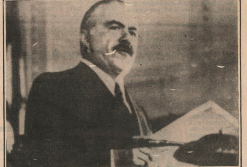
Sarney discursa no segundo dia da visita

Millhares de pessoas em várias partes do mundo, inclusive aqui em Salvador, vão se reunir nesta sexta-feira para prestar uma grande homenagem ao cantor Elvis Presley, que morreu aos 42 anos, no dia 16 de agosto de 1977. Conferências, exibição de filmes e tapes com shows inéditos de Elvis Presley marcarão a data na Bahia. Página 17.