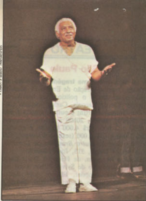
Homenagem a Caymmi na TV Cultura