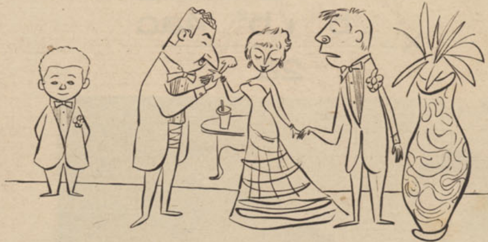
A LEITURA de mão está em moda, no Rio. Aqui, dois profissionais em atividade. Freddy, ainda aprendiz, observa.