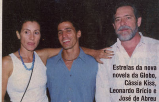
Estrelas da nova novela da Globo, Cássia Kiss, Leonardo Brício e José de Abreu