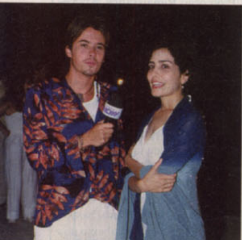
Repórter do Vídeo Show, Paulo Vilhena aproveitou para entrevistar Leticia Sabatella