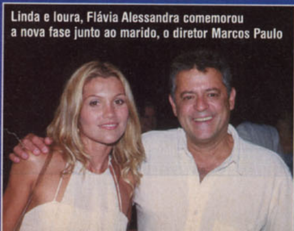
Linda e loura, Flávia Alessandra comemorou a nova fase junto ao marido, o diretor Marcos Paulo