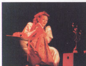
Domitila, A Marquesa de Santos