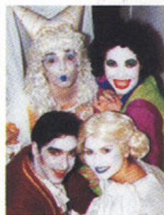
A Bela Aborrecida