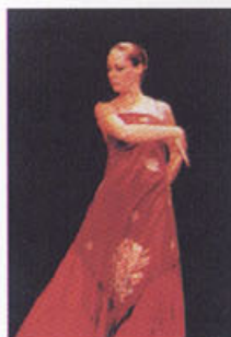
Projeto Dança Aberta