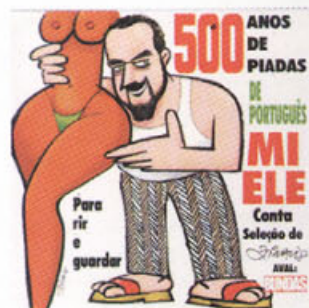
Lançamento de CD