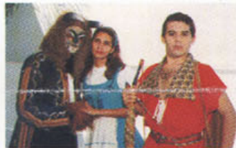
A Bela e a Fera