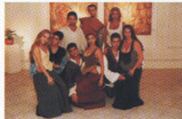
A Megera Domada