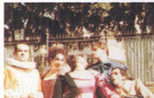
As Bruxas Também Amam