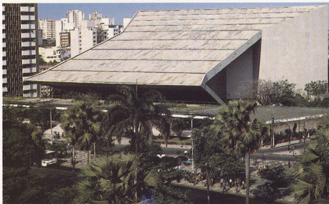
Inaugurado em 1958, no ano seguinte ao início da sua construção feita pela Construtora Norberto Odebrecht, o Teatro Castro Alves é destruído por incêndio, antes que o primeiro espetáculo se realize. A recuperação é feita em 1966 e 1967 pela própria CNO.

A iconografia selecionada é também um convite à reflexão sobre o que sempre esteve na base da superação contínua dos desafios, ao longo destes 50 anos: a EDUCAÇÃO no Trabalho.